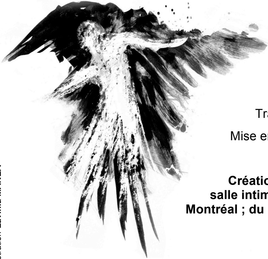
Illustration Lavinia MANEA